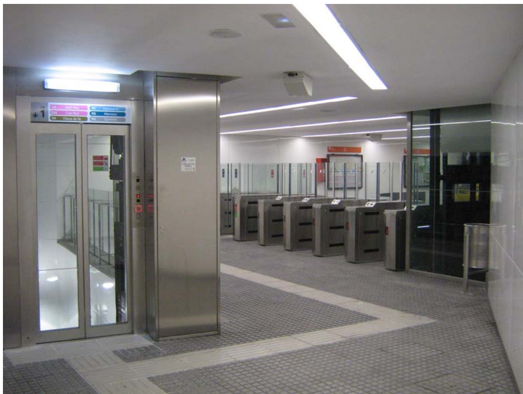
Vestíbul estació Sant Josep

En compliment de la Llei de promoció de l'accessibilitat i la supressió de barreres arquitectòniques del Parlament de Catalunya, des d'aquest dilluns la línia Llobregat-Anoia d'FGC ja està 100% adaptada per a persones amb mobilitat reduïda. Avui s'ha posat en funcionament l'últim ascensor que faltava per completar l'accessibilitat universal de la línia, concretament el que connecta el vestíbul de la recent remodelada estació de Sant Josep amb l'andana sentit Barcelona.