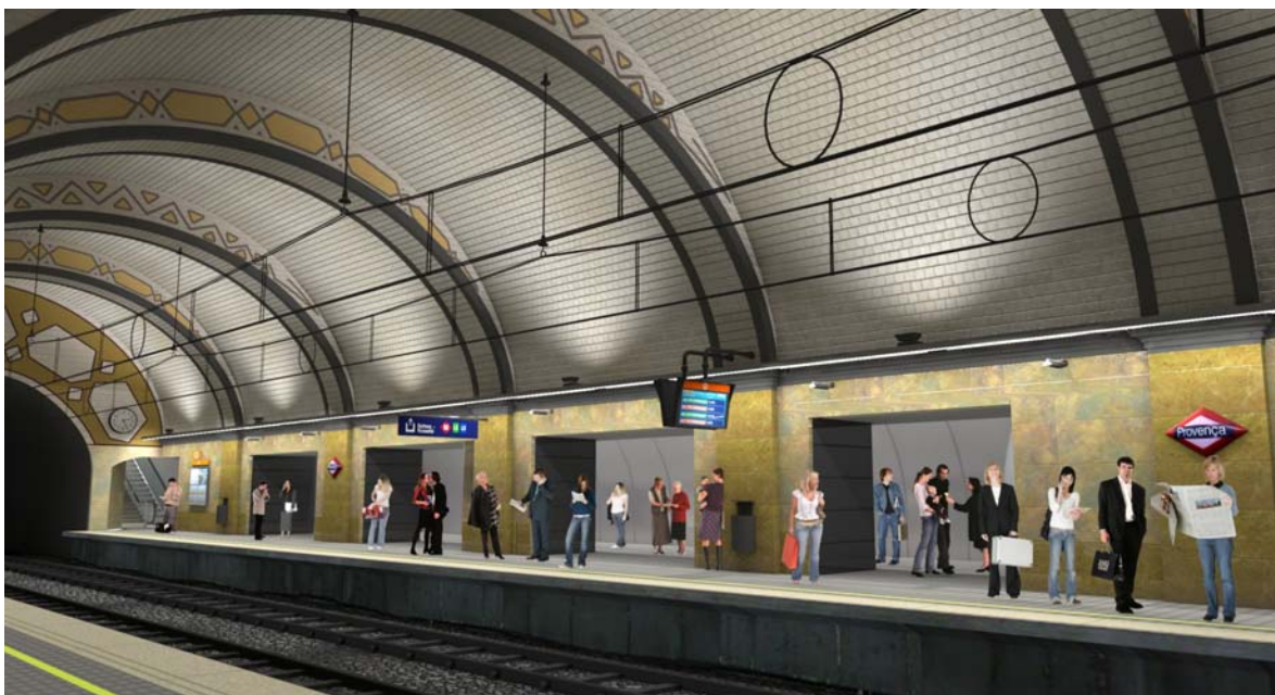
Imatge virtual de com quedarà l'andana, un cop ampliada.