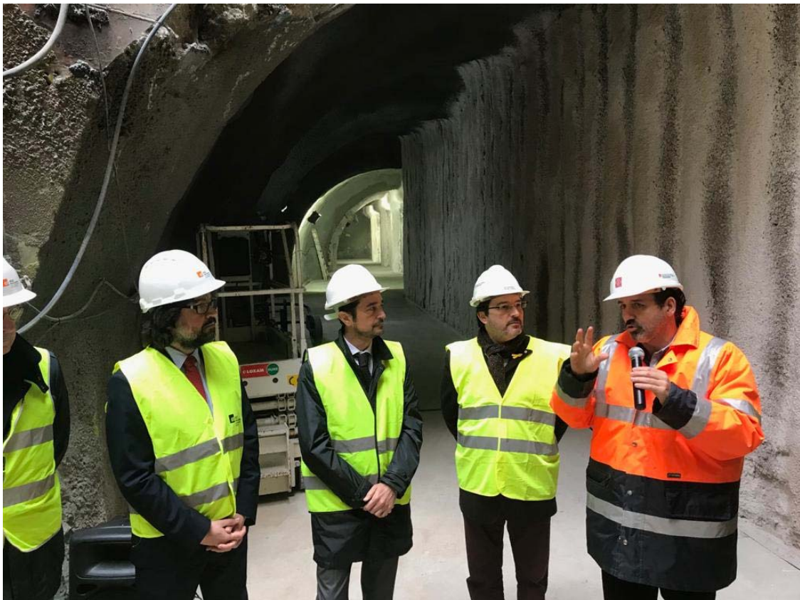
Calvet durant la visita d’aquest matí, amb Font, Gavín i Flores.

El conseller de Territori i Sostenibilitat, Damià Calvet , ha visitat avui les obres d’eixamplament de l’andana sentit Sarrià de l’estació de Provença de Ferrocarrils de la Generalitat de Catalunya (FGC), en fase molt avançada d’execució. Calvet ha remarcat que per solucionar un problema de capacitat a la segona estació més utilitzada del Metro del Vallès, “ hem realitzat una gran obra d’enginyeria singular des del punt de vista de la solució constructiva ”. A la visita també han participat el president d’FGC, Ricard Font,