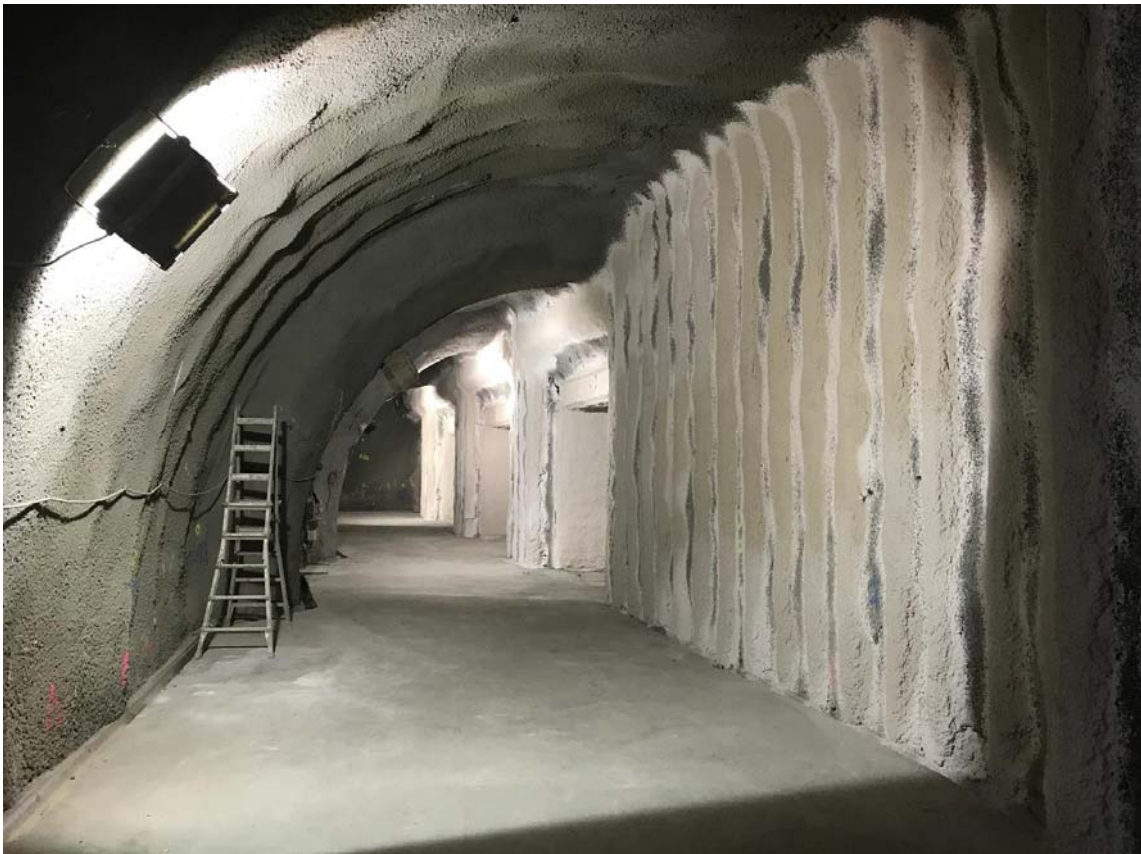
La galeria excavada per poder aixamplar l'andana.

Un dels elements significatius d'aquesta obra és el mètode de construcció utilitzat. L'ampliació de l'andana s'efectua mitjançant la construcció d'una nova galeria, de 50 metres de longitud, paral·lela a la volta de l'estació. Per excavar