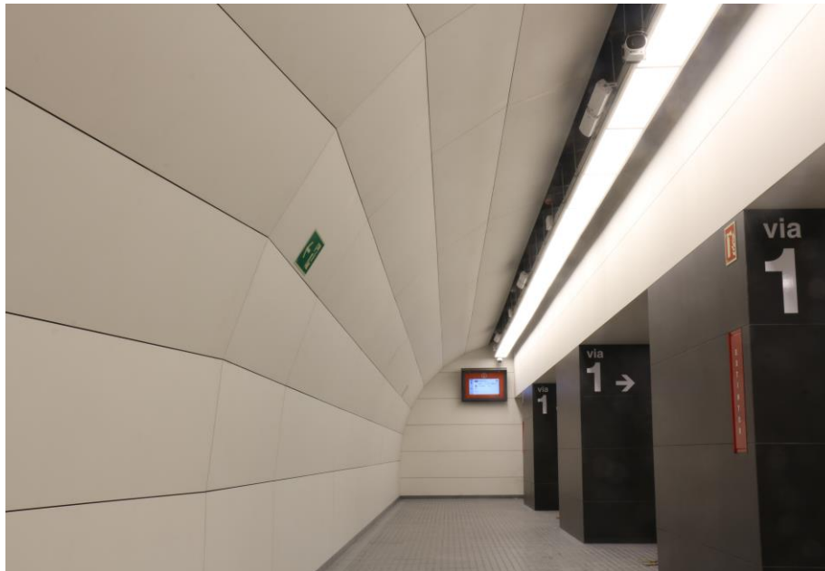
Part ampliada de l'andana