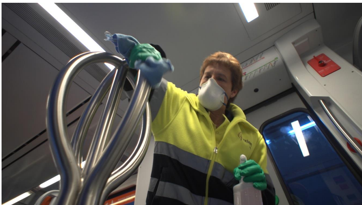
Personal de neteja desinfectant l'interior d'un tren d'FGC.

Continuen vigents les mesures higièniques que FGC ha anat prenent des de l'inici d'aquest episodi, seguint allò establert en el seu Pla de contingència per minimitzar el risc d'infecció entre les persones usuàries i el personal de la companyia.