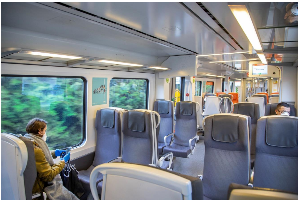
Usuaris d'FGC mantenint la distància de seguretat a dins del tren.