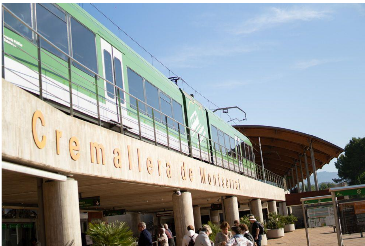
El cremallera de Montserrat.

Amb la venda anticipada en línia el client adquireix el bitllet amb data i circulació de pujada i de baixada concretes i s'assegura, així, la disponibilitat de places per al dia de visita. Per poder realitzar la compra en línia només cal accedir als webs de les respectives destinacions. L'objectiu és el de comercialitzar el gruix de l'oferta de places disponibles a través d'aquest canal i oferir a les persones usuàries una opció de compra més còmoda i dinàmica.