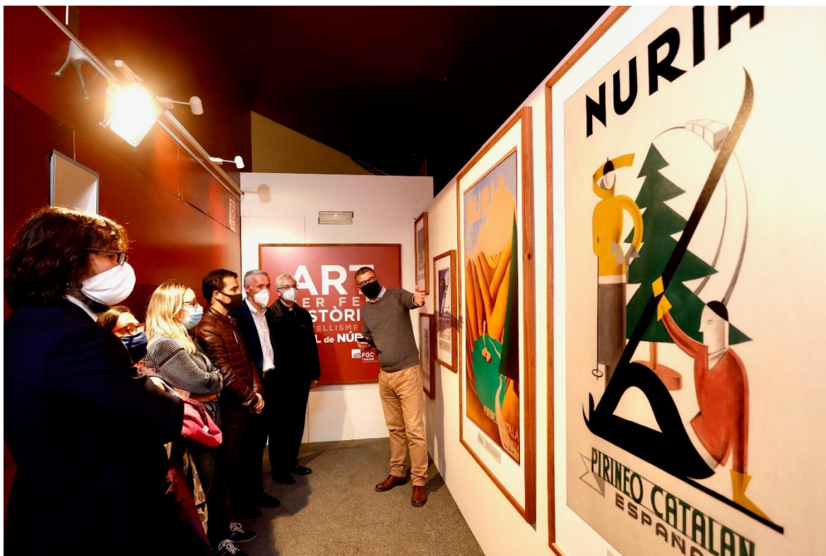
Jaume Clotet, propietari del cartell inèdit i director general de Comunicació del Govern, mostra el cartell inèdit al president d'FGC i altres autoritats.

L'estació de turisme i muntanya de Vall de Núria, gestionada per Ferrocarrils de la Generalitat de Catalunya (FGC), acull aquests dies l'exposició "Art per fer història. Cartellisme de Vall de Núria". La mostra, ubicada a la zona de serveis del Volum Nord de l'estació, és un recull de cartells publicitaris de l'estació que mostren com s'ha anat forjant una imatge potent de Núria com un lloc singular d'alta muntanya al llarg de segle XX.