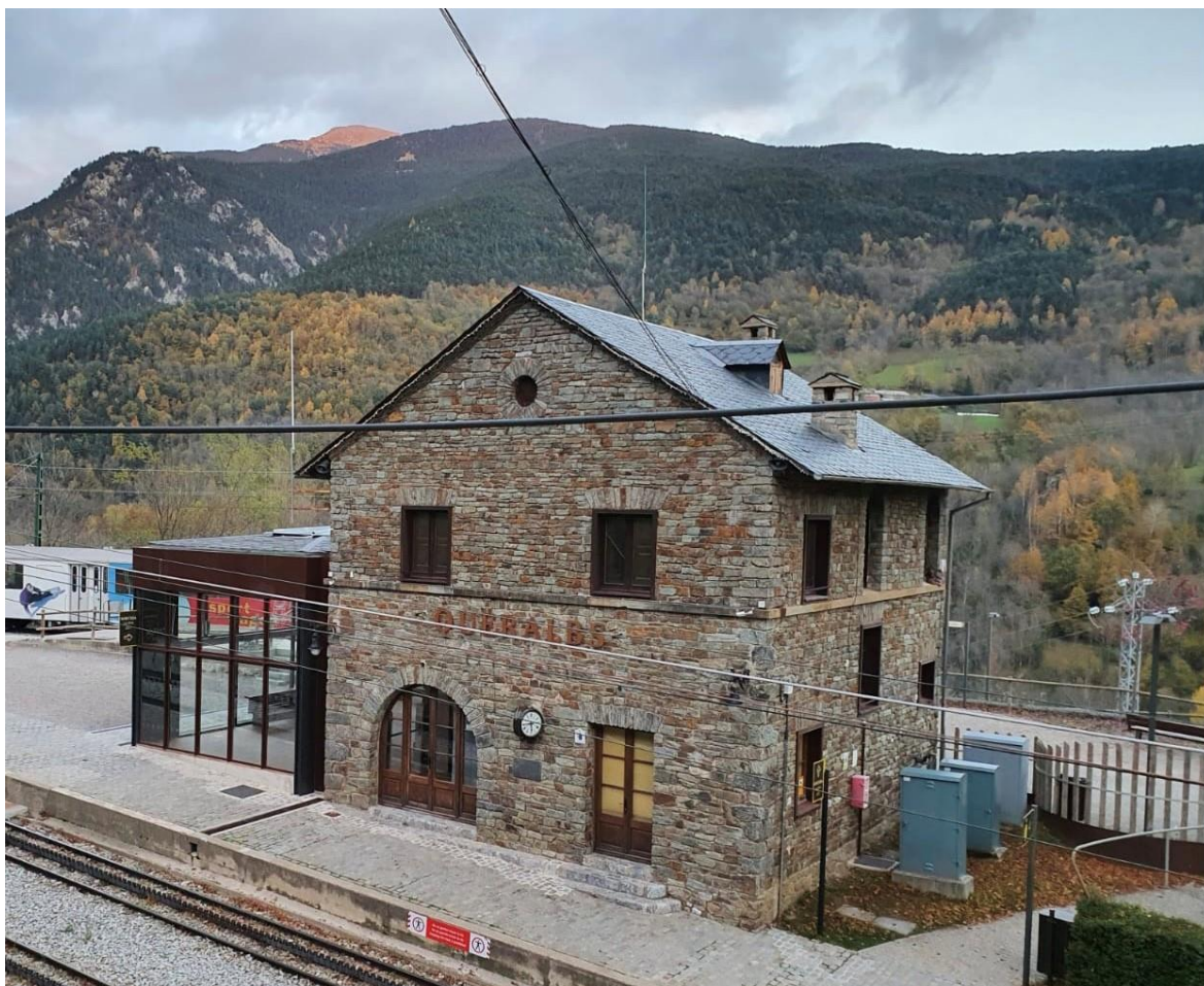
Foto de l'estació de Queralbs.

Ferrocarrils de la Generalitat de Catalunya (FGC) ha tret a licitació les obres de construcció del nou aparcament de l'estació de Queralbs del Cremallera de Núria, amb capacitat per a 75 places. Aquest nou espai d'estacionament de vehicles se