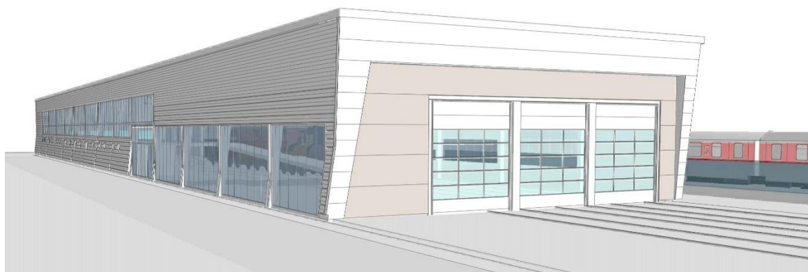
Disseny exterior de la nova nau que es construirà al costat de l'estació de Martorell Central.

Ferrocarrils de la Generalitat de Catalunya (FGC) ha adjudicat les obres de construcció d'una nau a l'entorn de l'estació de Martorell Central de la línia Llobregat-Anoia per a conservar i exposar una part del patrimoni històric de la companyia. Amb el nom de "L'espai de la via mètrica", en aquesta nau s'exposaran alguns dels vehicles històrics de la línia Llobregat-Anoia, més d'una vintena de peces preservades per Ferrocarrils que inclou locomotores, cotxes i vagons.