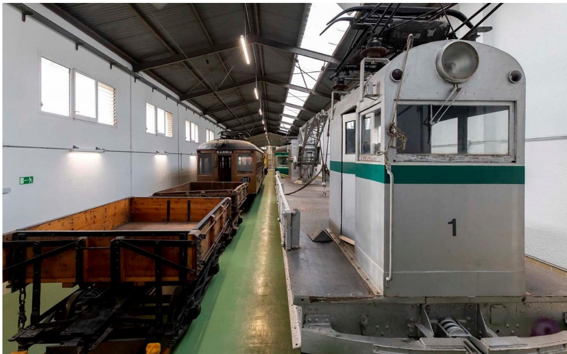
Espai "La Cotxera de Rubí", situat davant de l'antiga estació de Rubí d'FGC.