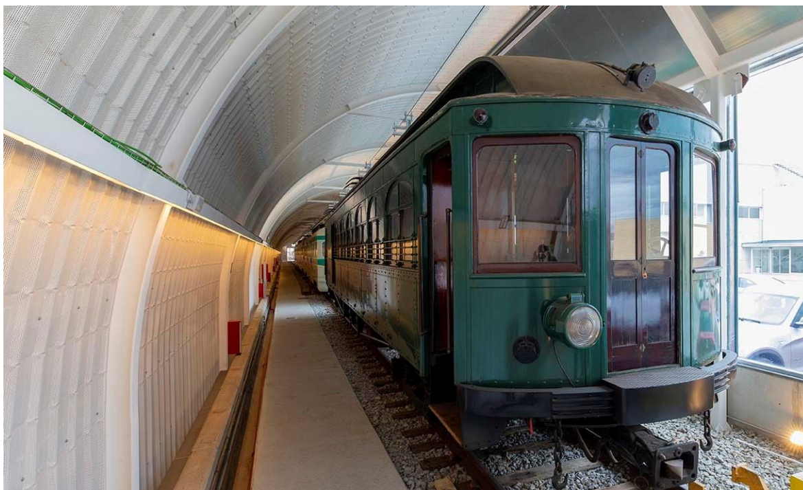
Espai "La Nau del tren històric del Vallès", ubicada al Centre Operatiu de Rubí d'FGC.