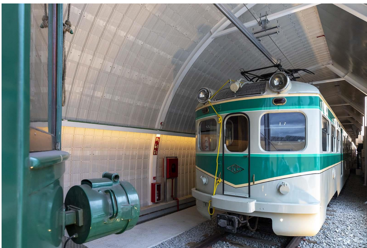
Unitat de la sèrie 400, dissenyada als anys 40 i recentment restaurada.