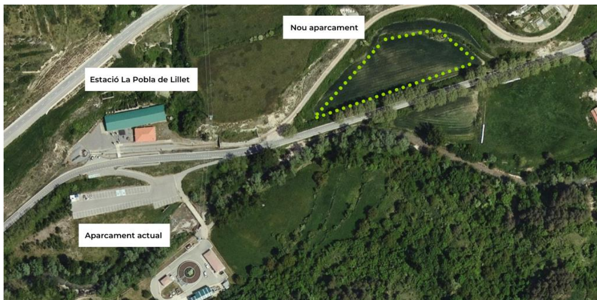
Mapa amb la ubicació de l'aparcament actual i de la nova zona d'estacionament.

Ferrocarrils de la Generalitat de Catalunya (FGC) ha iniciat aquesta setmana les obres del nou aparcament i accés a l'estació de la Pobla de Lillet, del Tren del Ciment. Els treballs consisteixen en la construcció d'una nova zona d'estacionament amb 88 places de capacitat a la mateixa banda d'on es troba l'estació, una rampa per a persones amb mobilitat reduïda i un nou accés des de la carretera B-402. La durada dels treballs serà de cinc mesos, amb una inversió de 421.000 euros.