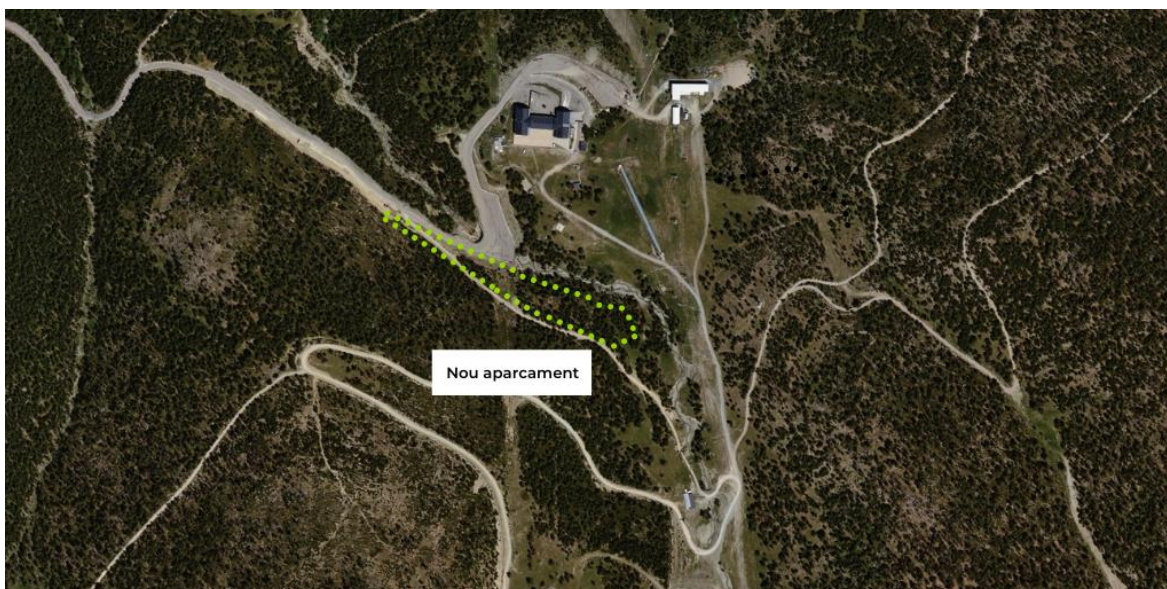
Espai on es construeix el nou aparcament.

Ferrocarrils de la Generalitat de Catalunya (FGC) està realitzant les obres del nou aparcament que donarà servei a l'estació d'esquí i de muntanya de Port Ainé, al municipi de Rialp, a partir de la propera temporada d'hivern. L'espai, de 9.000 m 2 tindrà una capacitat per a 290 vehicles, que se sumaran a les 956 places d'aparcament amb què ja compten actualment l'estació i els serveis turístics de l'entorn. Els treballs, amb una inversió de 935.000 euros, duraran 5 mesos. El projecte es realitza utilitzant tècniques de bioenginyeria per tal de respectar al màxim l'entorn i assegurar la integració paisatgística de l'actuació.