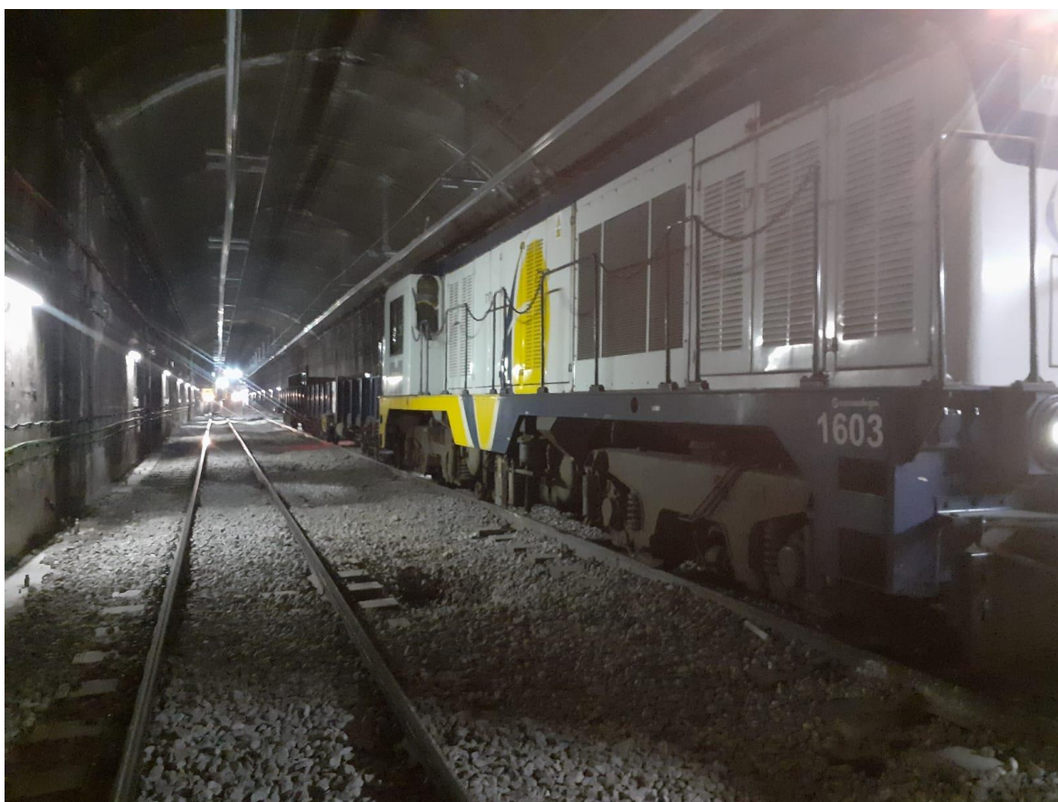
Una de les parts del túnel on s'actuarà.

Ferrocarrils de la Generalitat de Catalunya (FGC) inicia avui les obres de millora al túnel de la línia Llobregat-Anoia, entre les estacions d'Almeda i Cornellà Riera, que