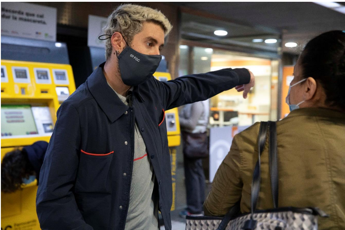
Un agent d'estacions atén una usuària d'FGC.

Les persones usuàries de Ferrocarrils de la Generalitat de Catalunya (FGC) puntuen amb un 77 sobre 100 la qualitat del servei ofert per la companyia. Aquest