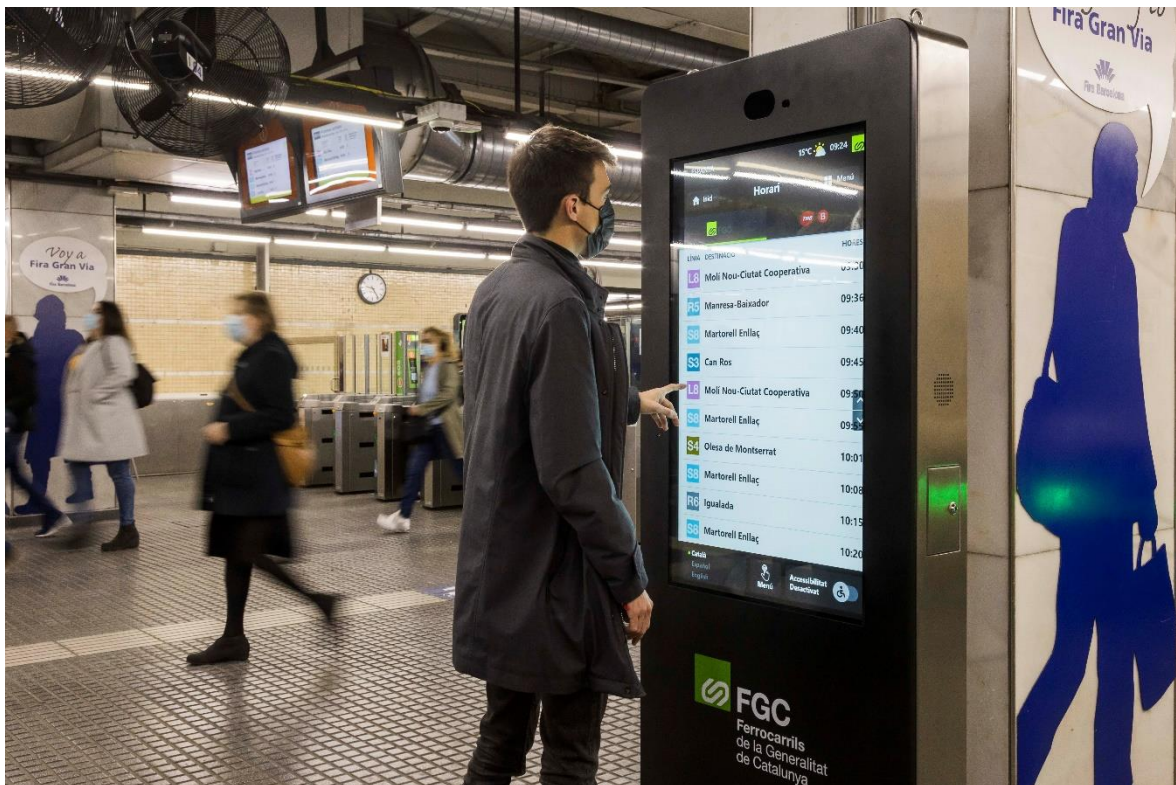
Quiosc interactiu a l'estació de Pl. Espanya.

Ferrocarrils de la Generalitat de Catalunya (FGC) ha posat en servei els nous quioscos interactius d'informació a les seves estacions per millorar l'atenció a les persones usuàries i facilitar l'experiència del viatge amb transport públic. Aquestes instal·lacions proporcionen en temps real dades d'interès per a les persones usuàries en el moment de viatjar com són els horaris, les incidències, les alteracions programades del servei o les possibilitats per completar el viatge amb altres operadors.