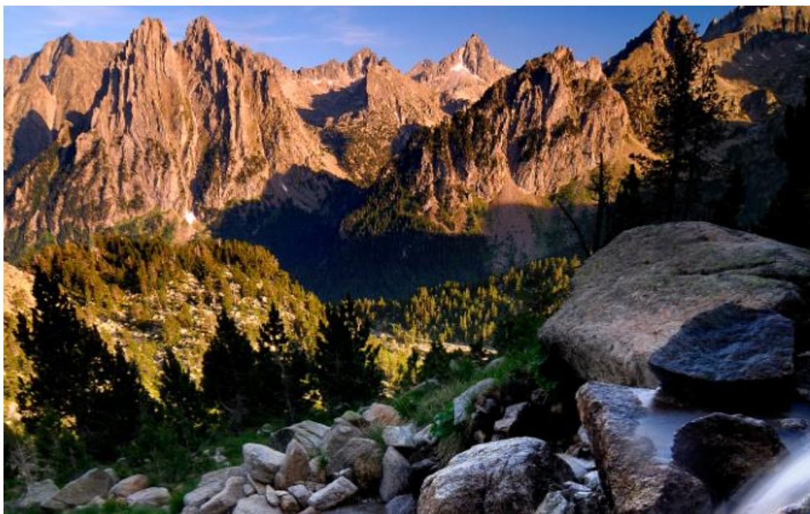
Parc Nacional d'Aigüestortes i Estany de Sant Maurici – Arxiu PNAESM.

Les estacions de muntanya gestionades per Ferrocarrils de la Generalitat de Catalunya (FGC) -La Molina, Vall de Núria, Vallter, Espot, Port Ainé i Boí Taüll-